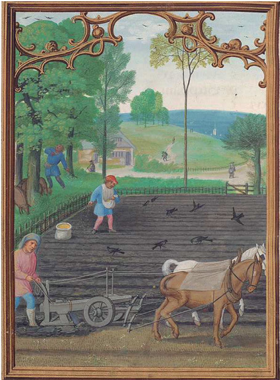
Figura 2. El treball agrícola era una de les bases de l'economia d'Oliva (Extret de «Llaurant i sembrant llavors» [miniatura] de Simon Bening, Da Costa Hours [calendari: setembre], ca. 1515, Gant, 172 x 125 mm. Consultat des de The Morgan Library & Museum [en línia], < https://www.themorgan.org/collection/da-costa-hours/20 > [consulta: 23 novembre 2019]. Biblioteca Pierpont Morgan, Departament de Manuscrits Medievals i Renaixentistes [MS M.399, fol. 10v], Nova York).