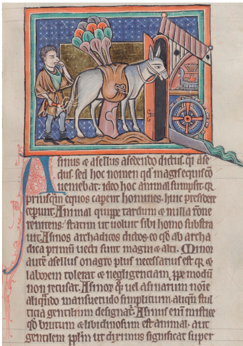
Figura 3. Els molins eren un lloc fonamental del món rural (Representació de l'interior d'un molí d'aigua medieval amb roda inferior [miniatura]. Extret d'anònim, Bestiary, ca. 1226-1250, Anglaterra.).