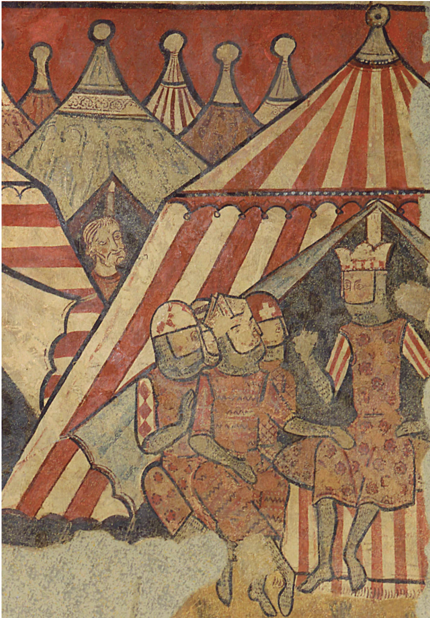
Figura 1. La conquesta cristiana va suposar un canvi total (Detall del gran fresc del Palau Aguilar, amb Jaume I i els seus consellers militars Gilabert de Cruïlles, Berenguer de Palou, bisbe de Barcelona, i Ramon de Centelles, entre d'altres, preparant l'assalt a Madina Mayurqa , capital de l'illa de Mallorca [pintura mural], anònim, ca. 1285-1290. Consultat des de MNAC [en línia], < https://www.museunacional.cat/sites/default/files/071447-000_002629_3.jpg > [consulta: 23 novembre 2019]. Museu Nacional d'Art de Catalunya, Barcelona).