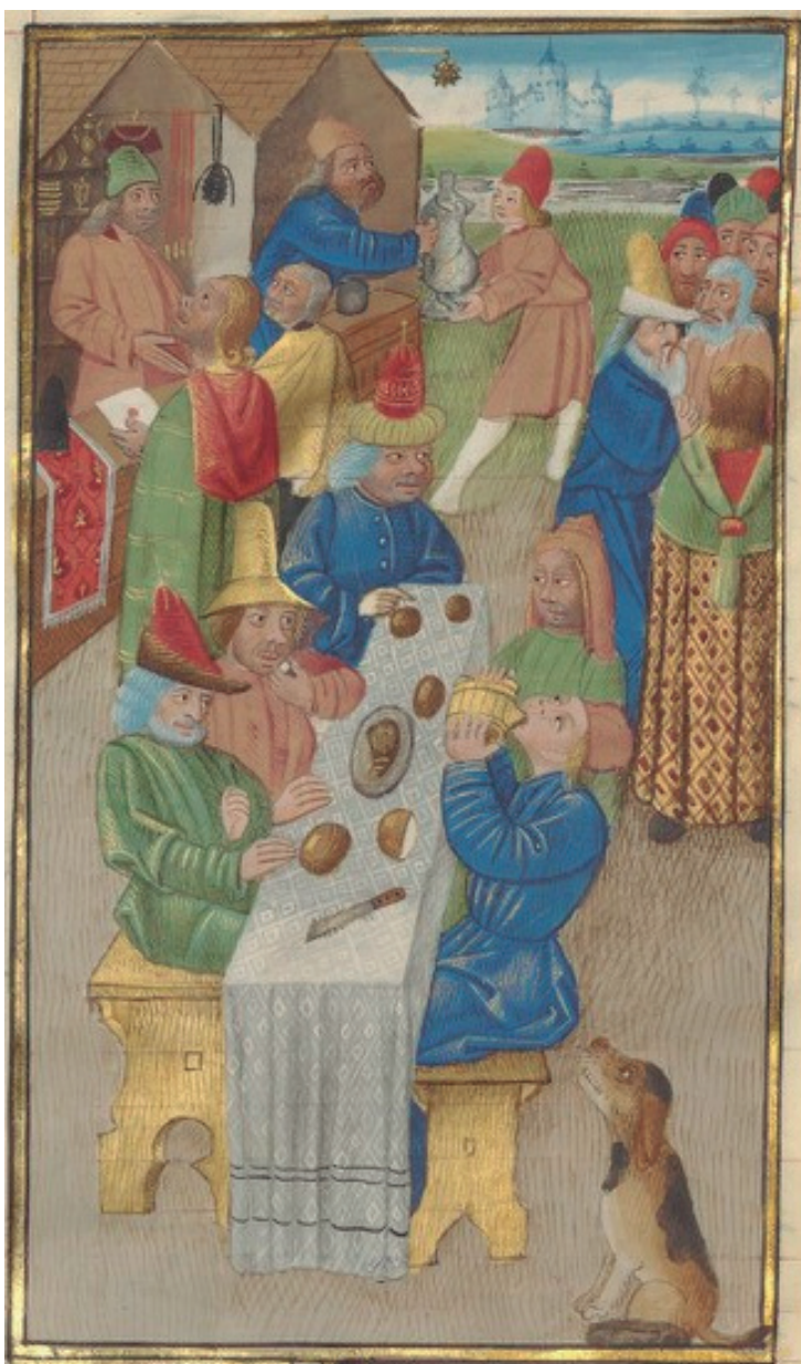
Figura 5. Els mercats eren punts d'intercanvi i sociabilitat (Extret de «Menjar de camperol» [miniatura] d'anònim, La Politique d'Aristote , traduite par Nicolas Oresme, ca. 1401-1500. Consultat des de BnF Catalogue général [en línia], < https://gallica.bnf.fr/ark:/12148/btv1b55013411d/f17.highres > [consulta: 23 novembre 2019]. Biblioteca Nacional de França, Departament de Manuscrits [22500], París).