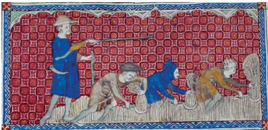
Figura 6. El control dels homes era la base del feudalisme (El lloctinent del senyor supervisa la faena dels camperols durant la collita del blat [miniatura]. Extret de Queen Mary Master, The Queen Mary Psalter , ca. 1310-1320, Anglaterra. Biblioteca Britànica [Ms. Royal 2. B. VII, f. 78v], Londres).